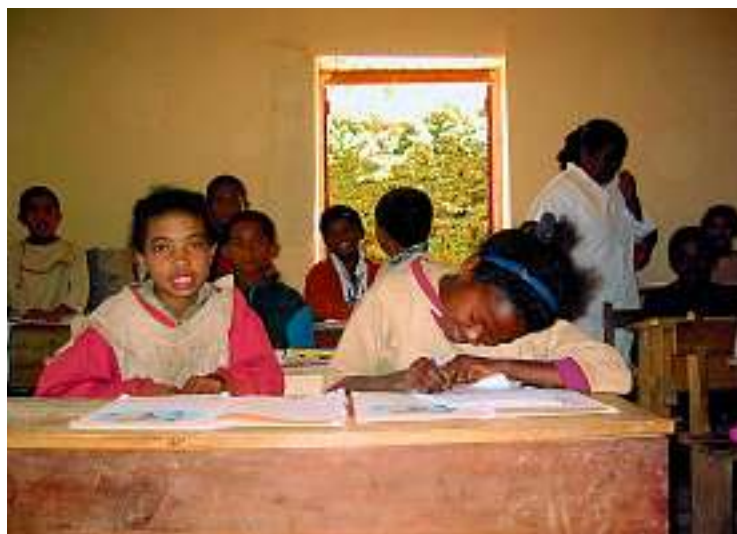
Madagaskar: Schülerinnen während dem Unterricht.